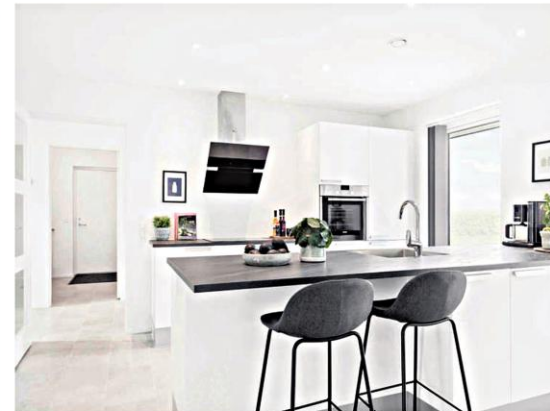
Håbet med de nye andelsboliger er at kunne trække både børnefamilier og ældre til Kloster. I bedste fald kan husene også gøre det interessant for ældre, der allerede bor i byen, at rykke ud af deres parcelhus for at flytte i andelsbolig og dermed give plads til tilflyttere andre steder i byen. Illustration

Bosætningsformanden ved alt om, at andelsboliger i