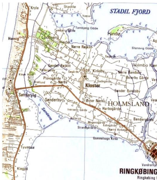
Nutidigt kort over Holmsland-området med de afvandede områder nord for Søndervig-vejen og Sandene med den brudte dæmning syd for Søndervig-vejen.

tal for projektet blandt de 33 lodsejere.