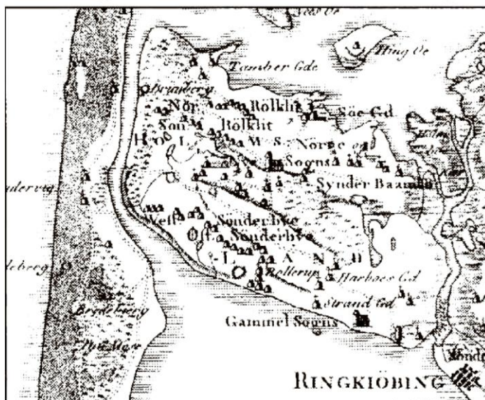
Holmsland for 1800 – mod vest afskåret fra Klitten af strømmen (Sandene) mellem Stadil Fjord i nord og Ringkøbing Fjord i syd, mod øst afskåret fra fastlandet af Vønå.